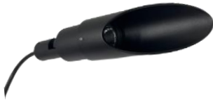
SAPPHIRE ET7066 1 piece