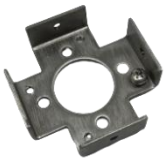
WALL MOUNT BRACKET 1 piece