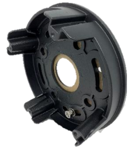
Die Cast Base Plate